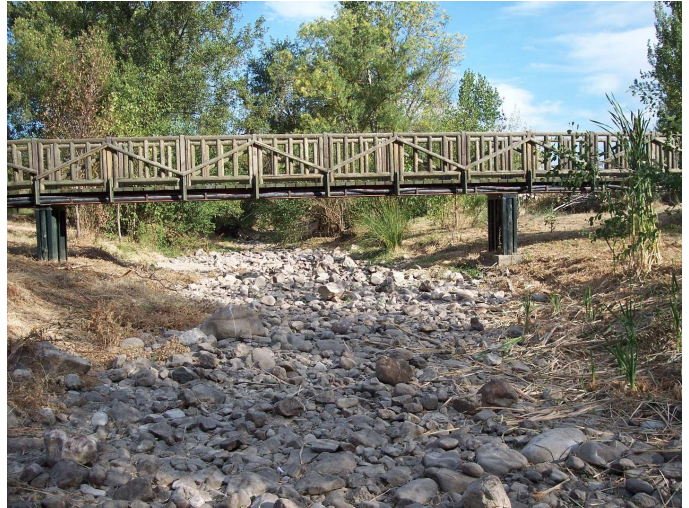
Foto 2. Zona del área recreativa de San Agustín de Guadalix. Hay numerosos árboles desecados por falta de humedad. No queda rastro de vida acuática.