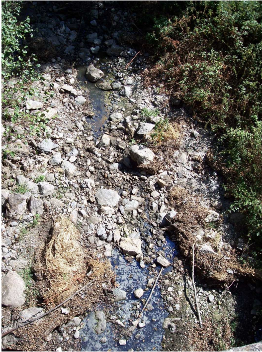
Foto 1. Cauce desde el puente de la carretera Pedrezuela a urbanización Corepo. En esta zona son evidentes los restos de hidrocarburos en las charcas aisladas del cauce.