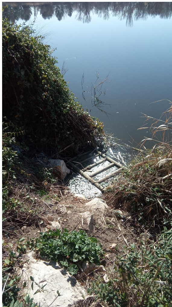
Punto de salida del colector (a la izquierda) con restos de los materiales grasos. 27-2-2019