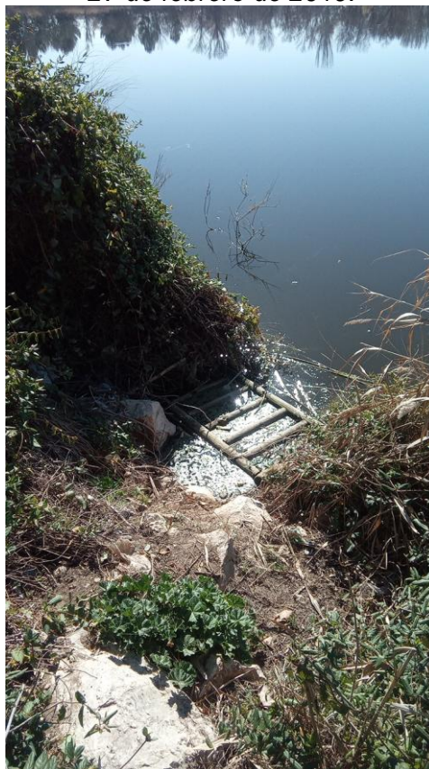
Punto de salida del colector (a la izquierda) con restos de los materiales grasos. 27-2-2019

En la fotografía se pueden observar la lámina lechosa que cubre la superficie de la lámina de agua. 27 de febrero de 2019.