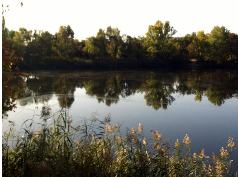
En la fotografía se pueden observar la lámina lechosa que cubre la superficie de la lámina de agua. 24 de octubre de 2014.