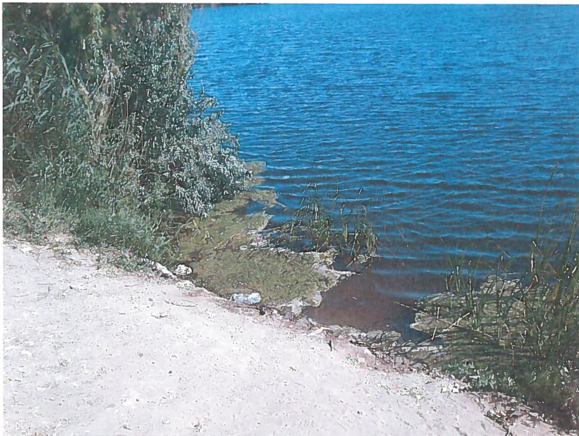
Restos del residuo graso flotando en la ribera sur de la laguna. 31 de mayo de 2014. Los restos proceden de algún vertido efectuado en días anteriores y arrastrados por el viento.