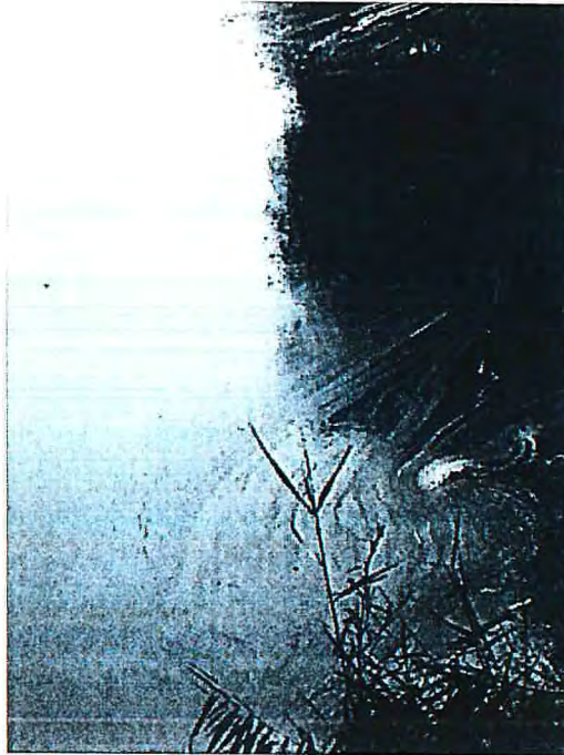
Fotografía tomada el 24 de agosto de 2013. Una semana después aun se percibían restos del vertido.