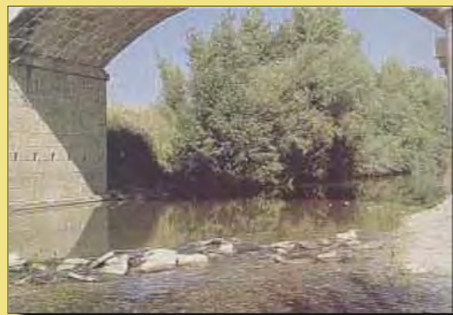
Puente de Talamanca del Jarama