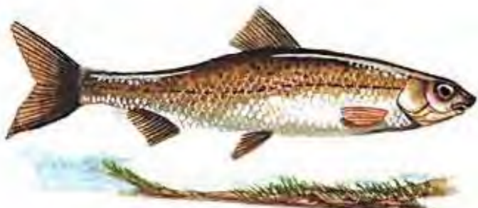
Boga de río, una especie autóctona del Jarama de la que hoy sobreviven algunos ejemplares en los tramos superiores