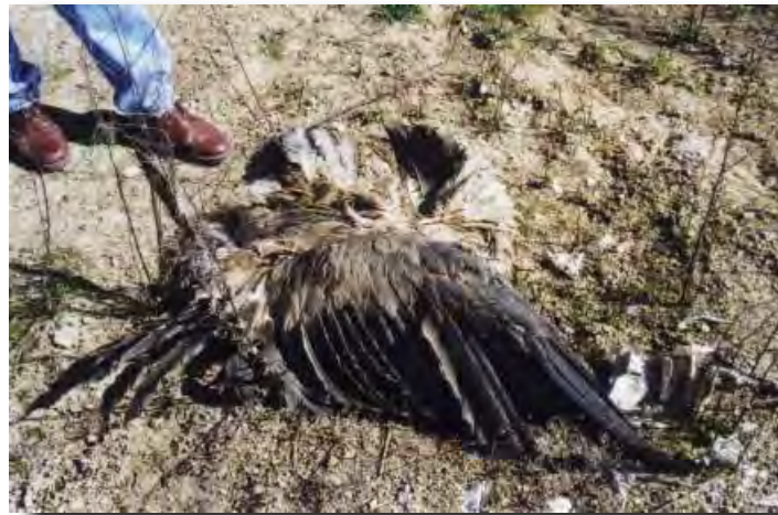
Cadaver de buitre joven encontrado al comienzo de 2000 en Velilla de San Antonio

C. Gran parte de los cotos incumplen la prohibición expresa prevista en la Ley 6/94: entre ellos todos los que afectan a ZONAS A y C.