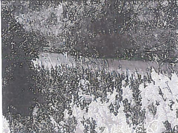
Inmediaciones del punto de vertido. Se puede apreciar la mezcla de lodo y el agua del río.