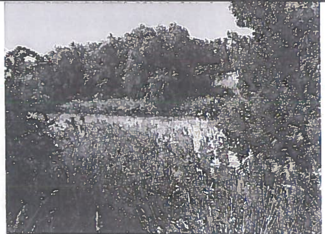
Efectos de los vertidos aguas abajo a la altura de la estación de aforos "AR17-Mejorada-San Fernando"..