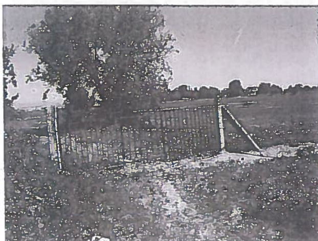
Vista desde el punto de vertido al río. Al fondo se observan las instalaciones de Hormigones del Corredor S.L.