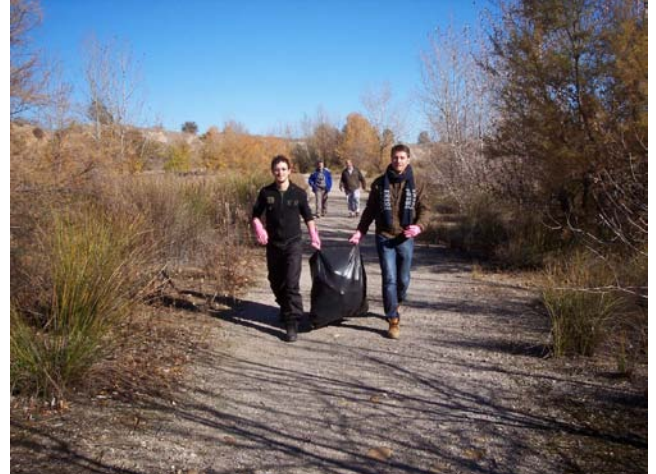
Trabajos de retirada y vista parcial de las bolsas acumuladas en el punto 1 del plano adjunto