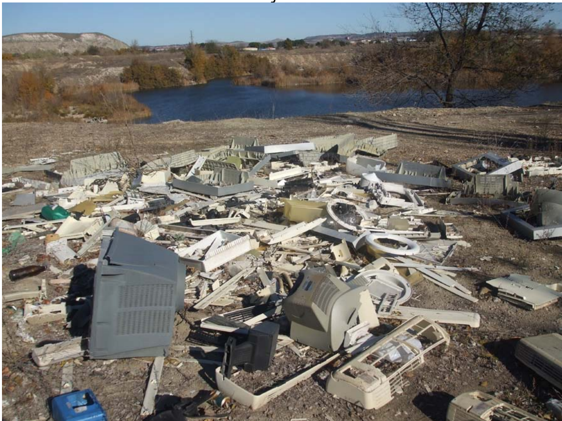
Restos de material informático en zona 2 del plano adjunto