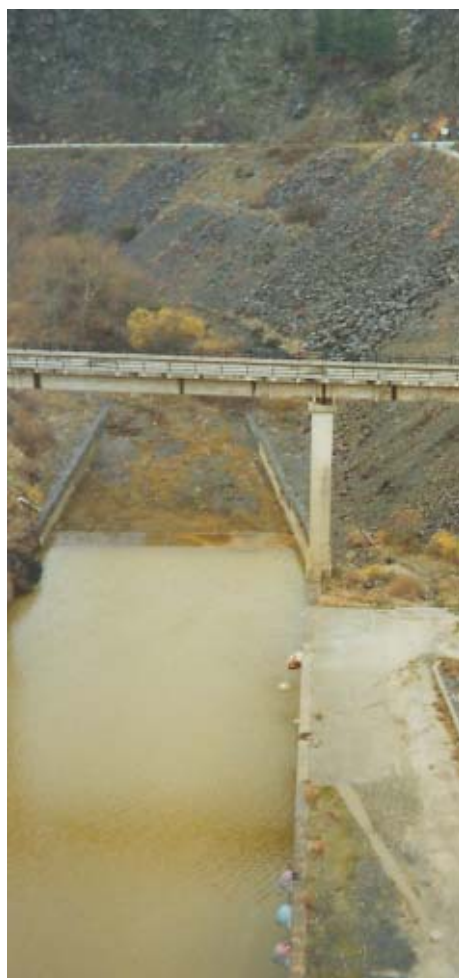
Tramo al pie de la Presa de El Vado (río Jarama). Diciembre de 2000.

Art. 98. Limitaciones medioambientales en las autorizaciones y concesiones: “Los organismos de cuenca, en las concesiones y autorizaciones que otorguen, adoptarán las medidas necesarias para hacer compatible el aprovechamiento con el respeto del medio ambiente y garantizar los