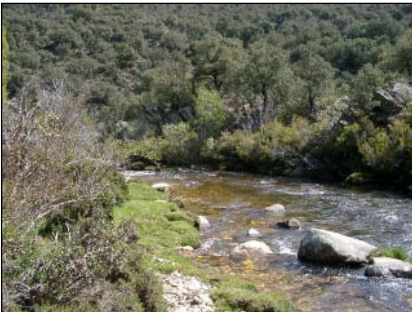
----- Río Jarama aguas arriba de la presa de El Vado

Comarca del Jarama, 10 de septiembre de 2003