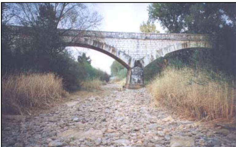
Puente de Torremocha del Jarama. Verano de 1999.

El Jarama es el mejor y más dramático ejemplo de la situación por la que atraviesan los ríos de Madrid. Tras la importante sequía de 1992-1993 las compuertas de las presas de El Vado (Jarama) y Atazar (Lozoya) se han mantenido prácticamente cerradas entre los meses de primavera y otoño, dejando secos tramos de más de 20 Kms de cauces. A este efecto han contribuido los bombeos de aguas subterráneas (estrechamente relacionadas con las del río Jarama) que se llevan a cabo desde estaciones situadas a escasa distancia del cauce (4).